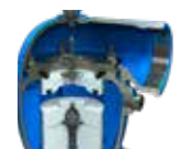
Ilman sisään päästämiseen vakuuissa (C70-AC)