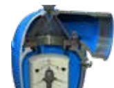
Ei paineentasaus (C70)