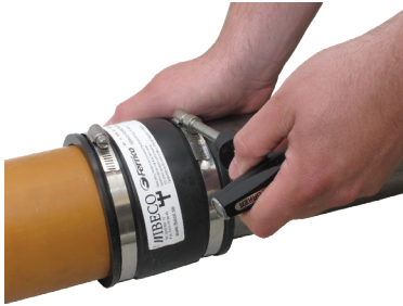
Fernco putkiliitin: 6Nm