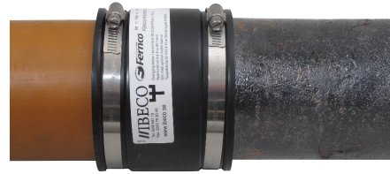
Koeponnista Fernco/Flexseal-putkiliitos ja sen sovellus 0,3 barin paineella.