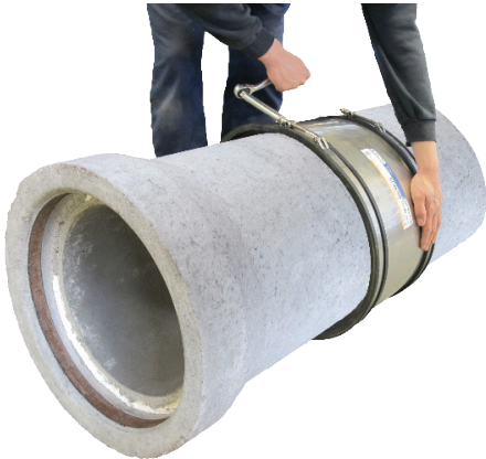
Flexseal-putkiliitokset: 80 - 299 mm, 6 Nm

Kiristä letkuklipsit käsin momenttiavaimen tai hylsyn avulla edellä mainitun kiristysmomentin mukaisesti.